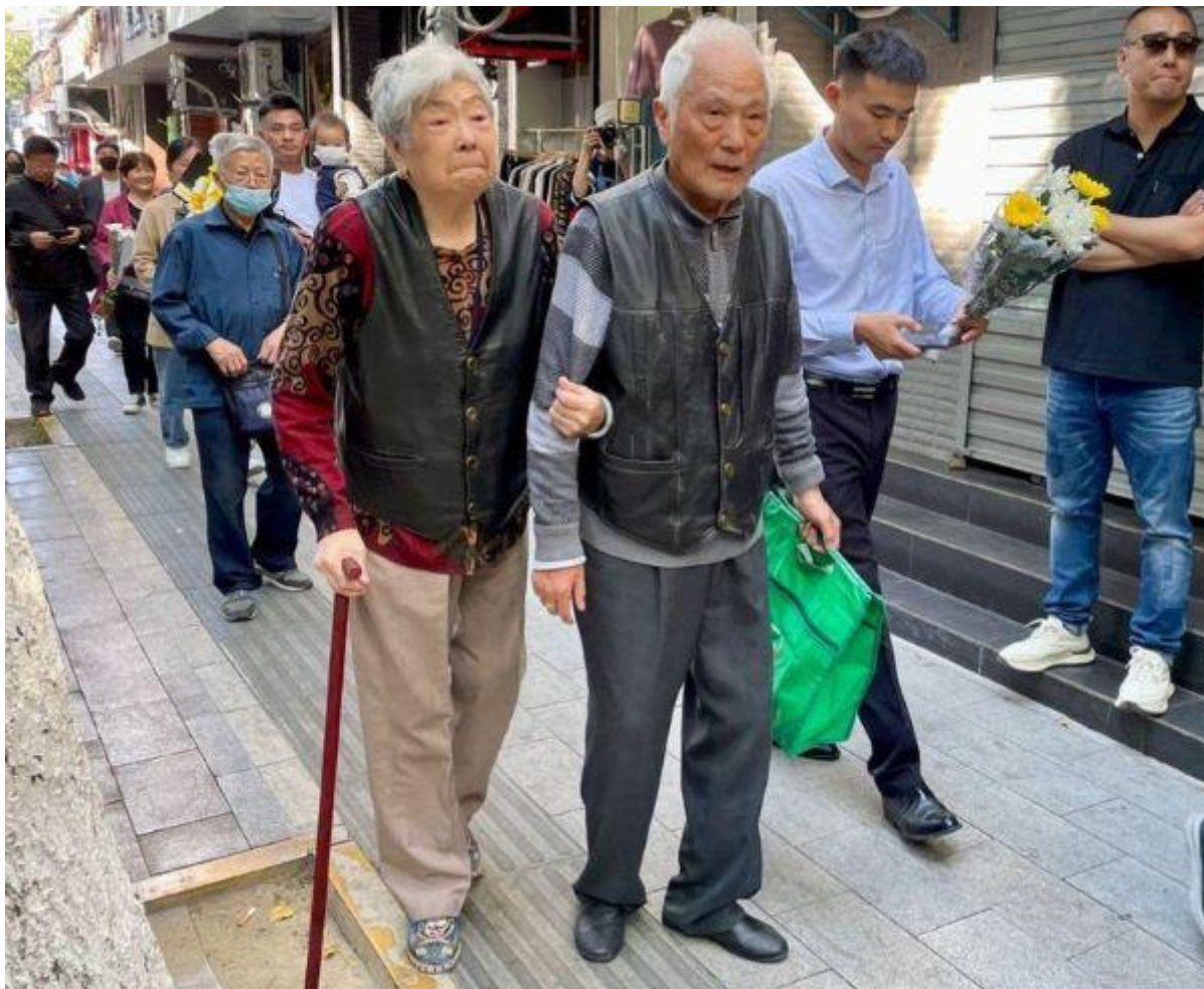
Người dân tự động đi viếng ông Lý Khắc Cường ở Hợp Phì