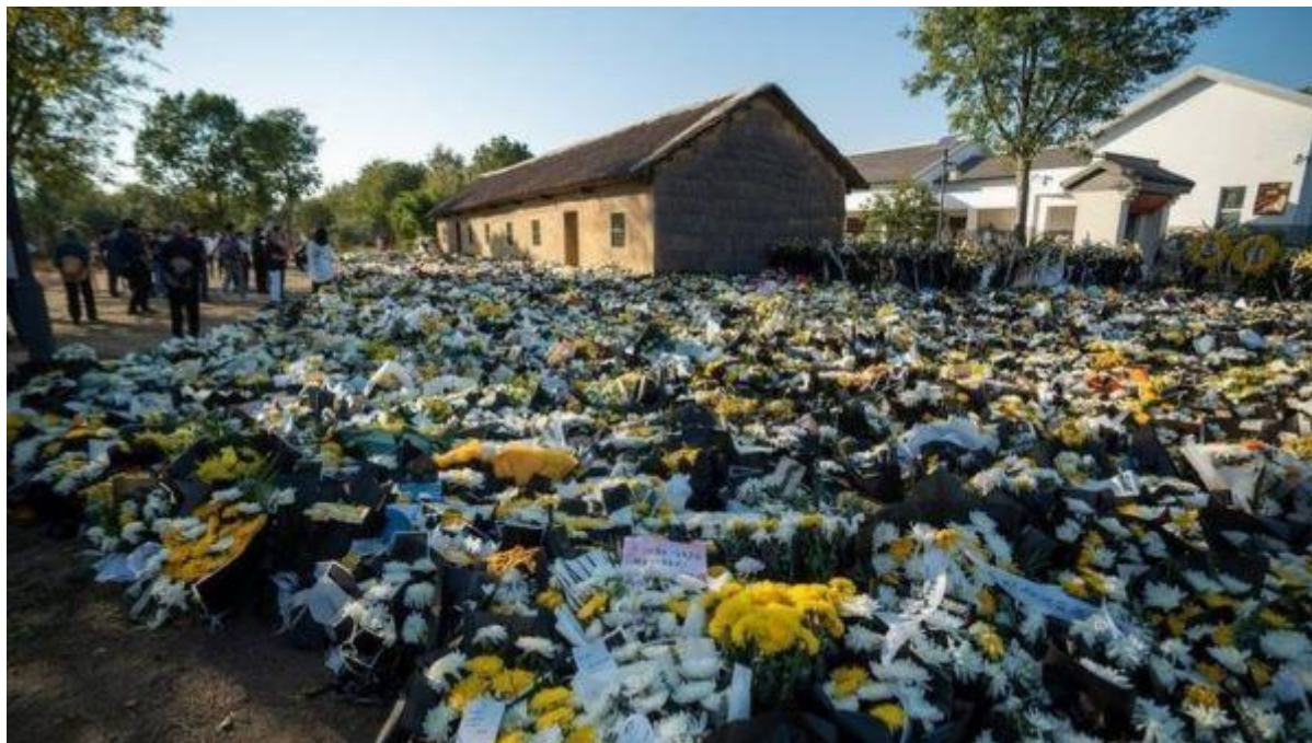
Nhà thờ họ Lý ở thôn Cửu Tử, trấn Định Viễn, tỉnh An Huy nhận được "rừng hoa" viếng của người dân