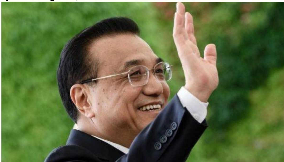
Cố thủ tướng Lý Khắc Cường

Nguy cơ căng thẳng với Nhật sẽ tăng, và con số doanh nhân Nhật tại TQ thậm chí sẽ giảm đi nhanh chóng sau khi ông Lý Khắc Cường chết, truyền thông Nhật đưa tin.