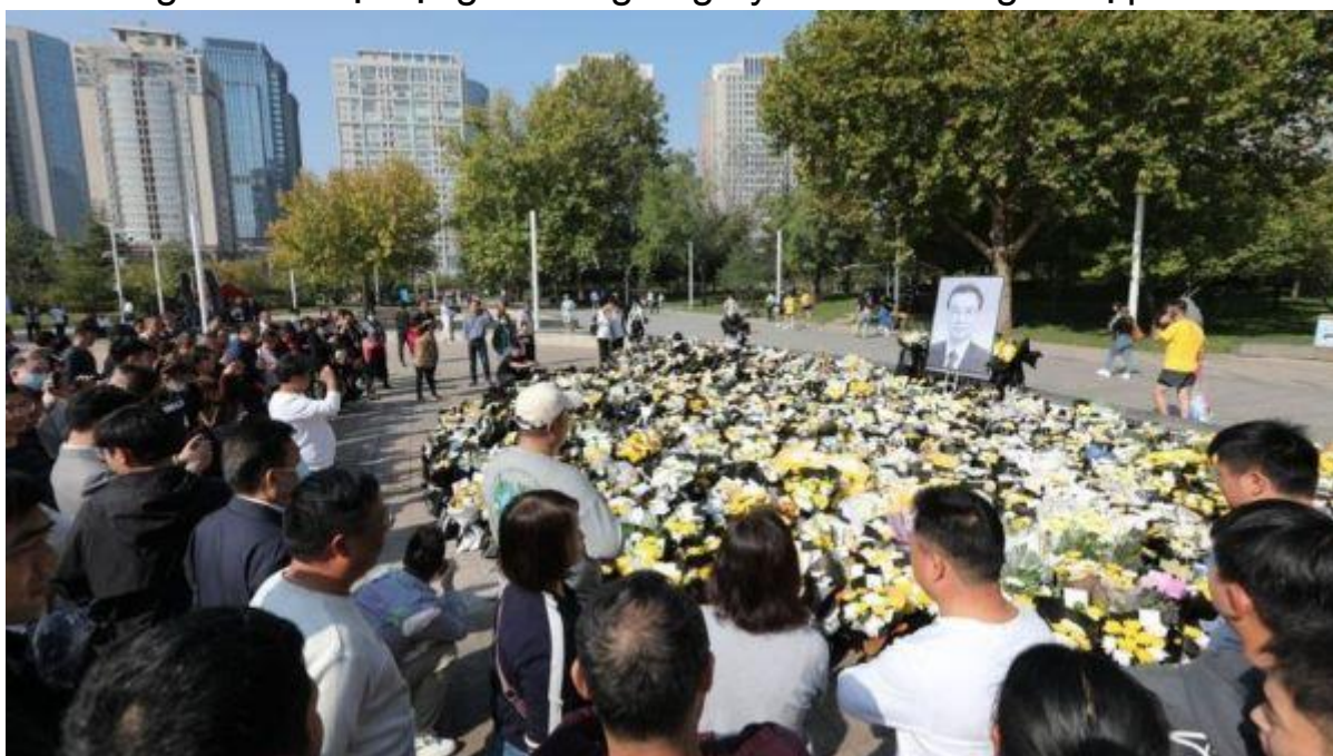
Ở Trịnh Châu cũng có cảnh người dân tự đặt hoa viếng ông Lý Khắc Cường